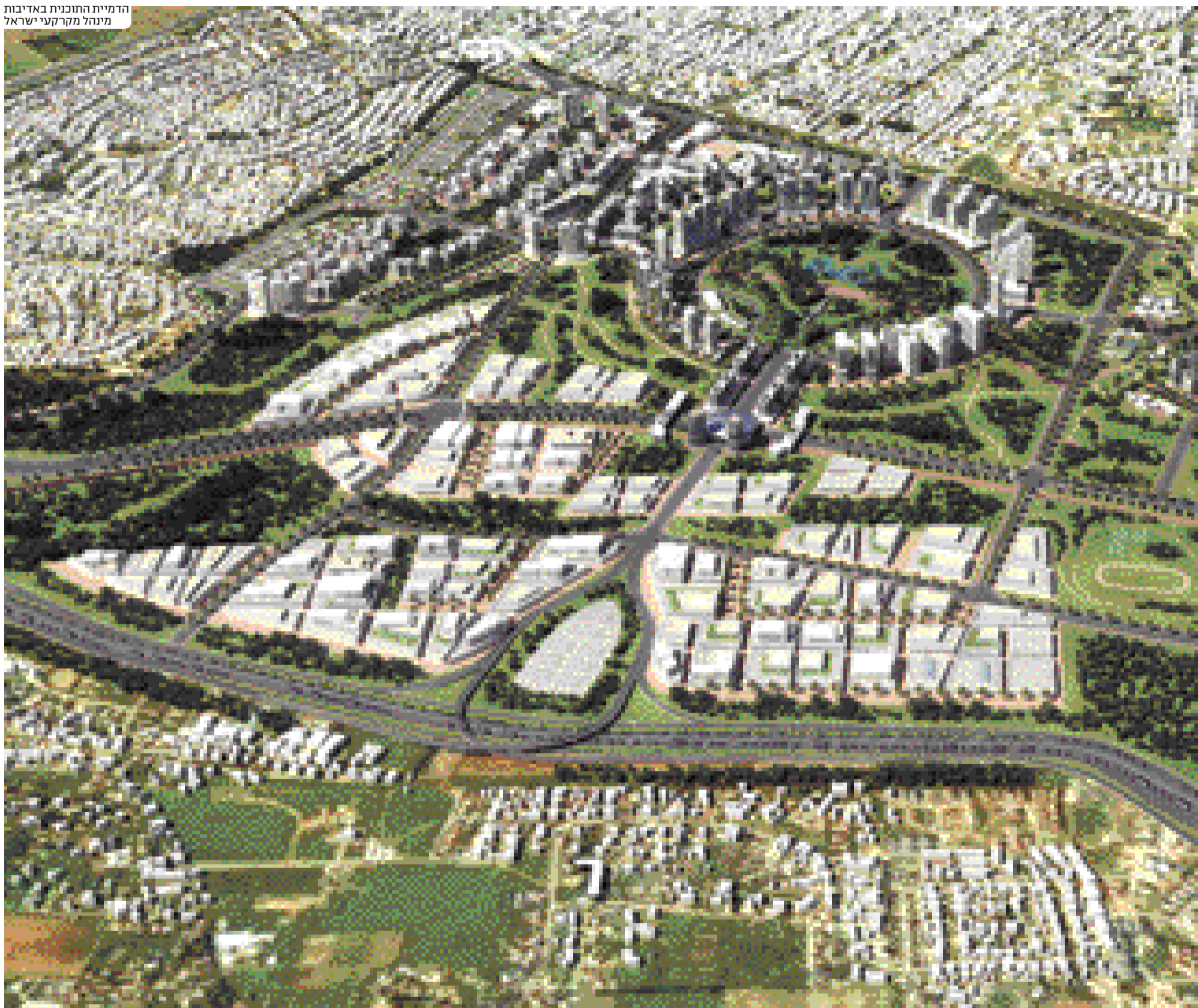
הדמיית התוכנית באדיבות מינהל מקרקעי ישראל

מערכות מסודרות לפינוי וטיפול בשפכים ובתוצרי לוואי של ייצור תחמושת, אך עד לפני כעשרים שנים היו מזורמים החומרים הרעילים אל הקרקע ומשם למי התהום. לקראת הפינוי עוברת החברה מהלך הפרטה אשר בסיומו צפויה החברה לעבור לפעול מדרום הארץ. "תעש מובילה כרגע מהלך להפרטה, שבסיומו, הצפוי להיות בשנת 2020, תעבור החברה לפעול מרמת בקע בנגב", נמסר מהחברה, "תעש איננה עוד גורם מזהם, ובשנים האחרונות השקיעה החברה יותר מ-200 מיליון שקלים בטיהור הקרקע. תעש פועלת על פי אמות מידה וסטנדרטים בתקני איכות סביבה של התעשיות בעולם המערבי. בנוסף, תעש מצויה בקשר שותף עם כל המשרדים הרלוונטיים ותעשה כל שיידרש כדי לסייע בתהליך ובפרויקט לקידום וטיהור הקרקע, שזיהומה בוצע לפני עשרות שנים ולא ב-20 השנים האחרונות. במידה שמסיבות אלו או אחרות תמשיך החברה לעבוד כחברה ממשלתית, תעש מחויבת לפרויקט המדובר ותעמוד בכל שיידרש ממנה כדי להוציא לפועל". במקום פועל גם מפעל IWI (תעשיות נשק ישראל).