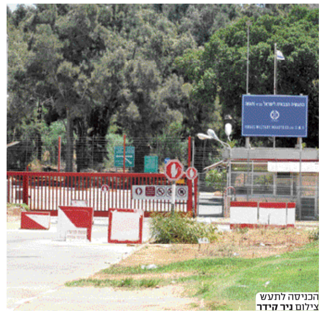
הכניסה לתעש

עדיף בעיני להעביר את כל השטח לאחת הערים, כדי שתהיה אינטראקציה בין הדיסציפלינות בתכנון ושתכנון הפארקים, בתי הספר ויחידות המגורים יהיו מתוכננות בהתאמה, אבל גם אם מפצלים את זה בין הרשויות המקומיות, אחרי התכנון, זה לא אסון אברהם פורז